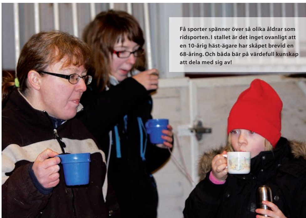
Få sporter spänner över så olika åldrar som ridsporten. I stallet är det inget ovanligt att en 10-årig häst-ägare har skåpet bredvid en 68-åring. Och båda bär på värdefull kunskap att dela med sig av!

Varför inte ge varandra lektioner istället? Eller helt enkelt, ta tiden att verkligen titta på